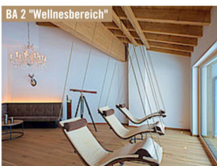
BA 2 "Wellnesbereich"