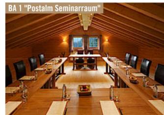
BA 1 "Postalm Seminarraum"