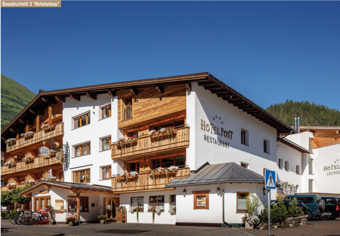
Baub Abschnitt 3 "Hotelanbau"