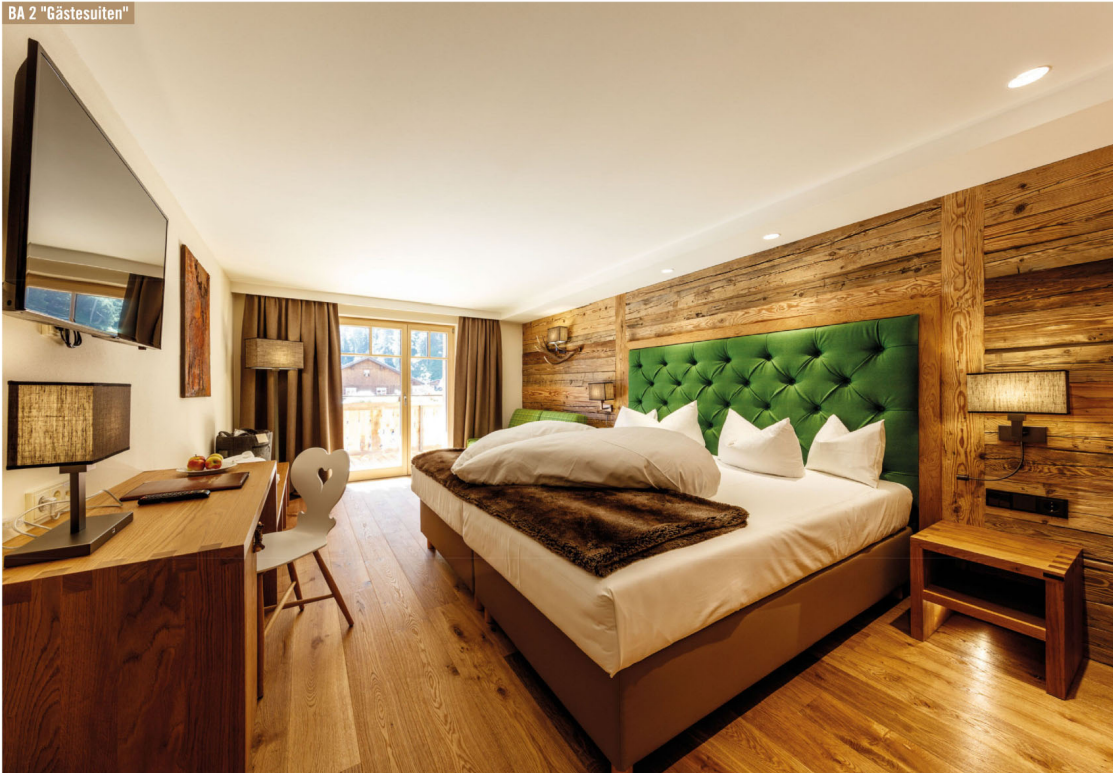
BA 2 "Gästesuiten"